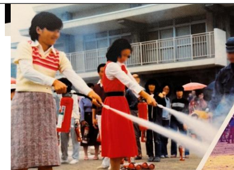
③ 平城第2団地/自治会による防災訓練