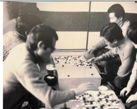
② 平城第2団地/集会所にて囲碁大会