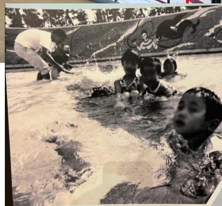
① 平城第2団地/水遊びスペース